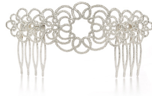
Ohrringe/ earrings „Medea II“ 925 sterling silver Haarkamm/ hair comb „Medea“ 925 sterling silver Photography: Anja Schneemann · Dress: Elbbräut